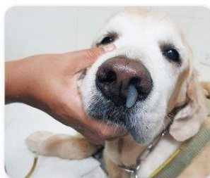
鼻水が止まらない...