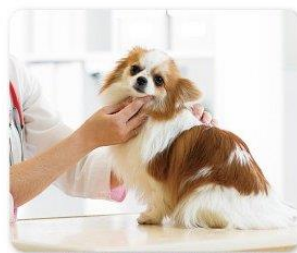
気道の炎症/感染の治療