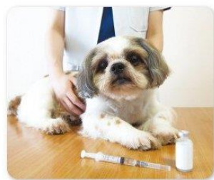
麻酔後の覚醒時にも