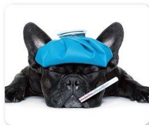
風邪により息苦しい...