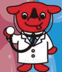
千葉県 マスコットキャラクター 「チーバくん」